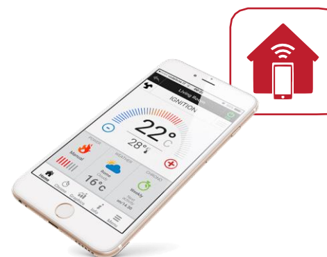
SYSTÉM DÁLKOVÉHO OVLÁDÁNÍ