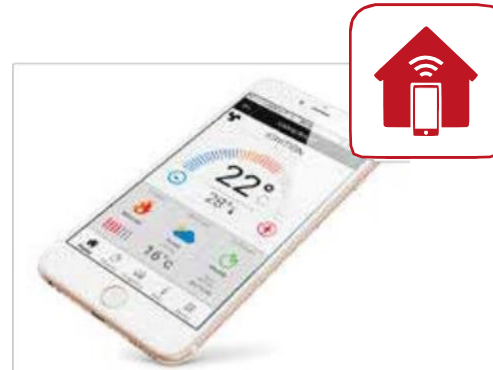
SYSTÉM DÁLKOVÉHO OVLÁDÁNÍ