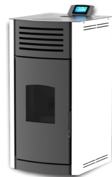
BÍLÁ / SLONOVINOVÁ RAL9003 / RAL 1015