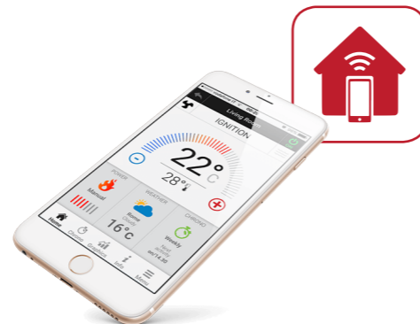
SYSTÉM DÁLKOVÉHO OVLÁDÁNÍ